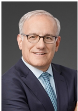
チャプマン – 雇用・労働法、雇用関連訴訟