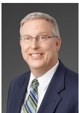
ホワイト – 移民法